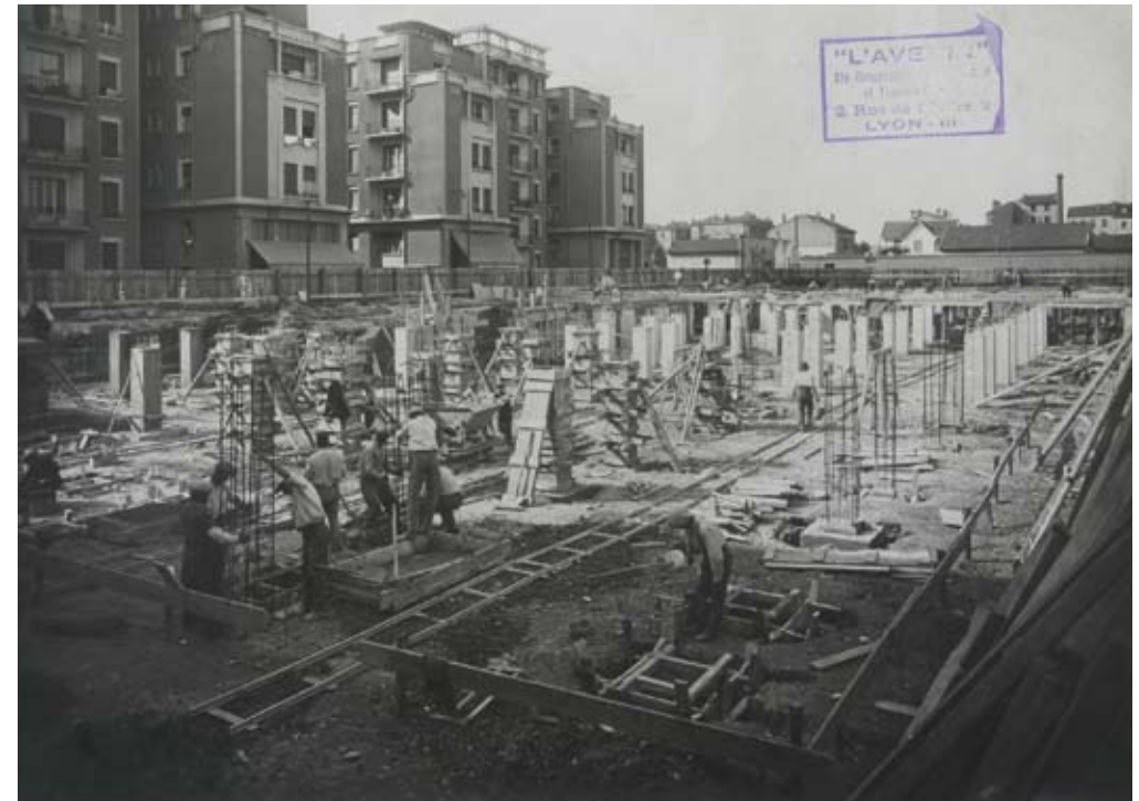
Plaque de verre E. Poix, pour l'entreprise « L'Avenir », Société coopérative de maçonnerie et travaux publics. Archives municipales de Villeurbanne