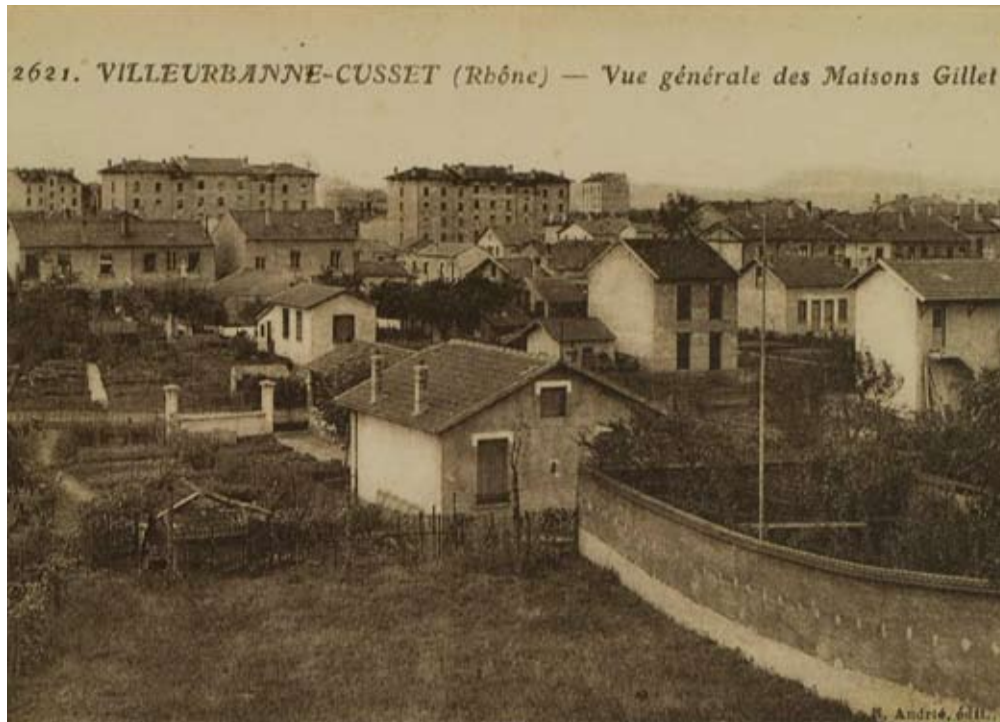
Carte postale d'après photographie, éditions E. Andrié.