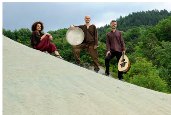
Trio Bassma