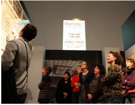
Visite rencontre en présence d'un chercheur en résidence au Rize