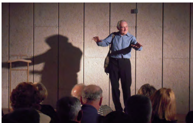
Bernard Gerland © DR