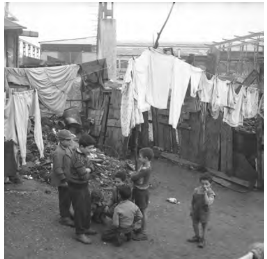
Bidonvilles à Lyon, années 1960

Dans ce contexte, l'association Grand Ensemble a réalisé l'exposition Récits d'engagement, 1954-1962 , à partir d'un important travail de recherche et avec l'objectif de restituer un pan méconnu de l'histoire franco-algérienne : de 1954 à 1962, des habitant(e)s de l'agglomération lyonnaise ont soutenu des Algériens engagés dans leur lutte pour l'indépendance.