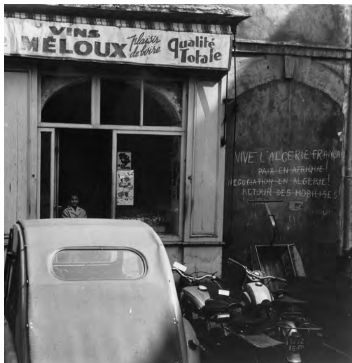
Café et graffitis à Lyon, années 1960