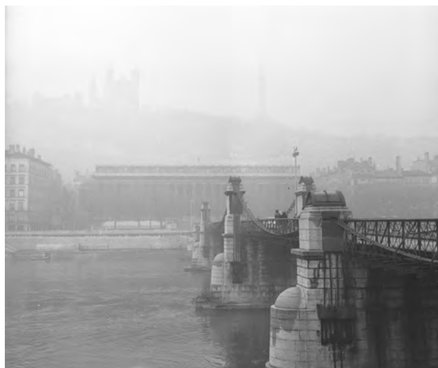
Le Palais de justice de Lyon dans la brume

L'exposition retrace leur parcours pendant la période, les conditions dans lesquelles ils ont pu exercer leur métier à différents moments du conflit, montrant la difficulté d'assurer les droits de la défense, alors qu'une « justice en guerre » s'engage dans une répression croissante.