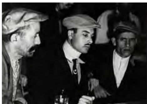
«La rupture oubliée»